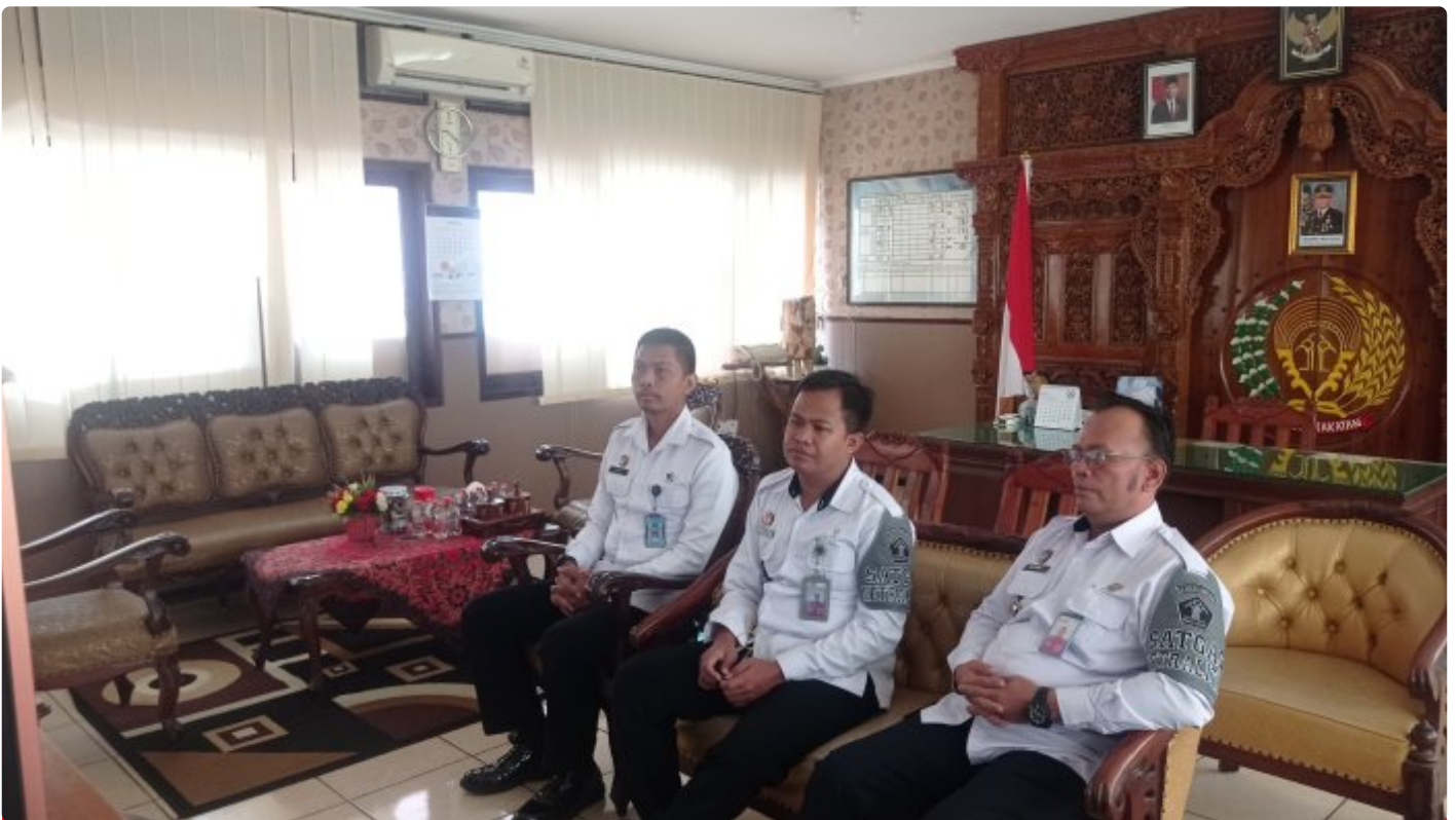
Rutan Blora Bergabung Dalam Giat Zoom Reformasi Birokrasi

Blora - Reformasi birokrasi merupakan sebuah kebutuhan yang perlu dipenuhi dalam rangka memastikan terciptanya perbaikan tata kelola pemerintahan, serta tata kelola pemerintahan yang baik adalah prasyarat utama pembangunan nasional sehingga dalam hal ini merupakan suatu aspek penting yang harus selalu dibangun dan dikuatkan dalam menjalankan tiap tugas dan pelayanan.