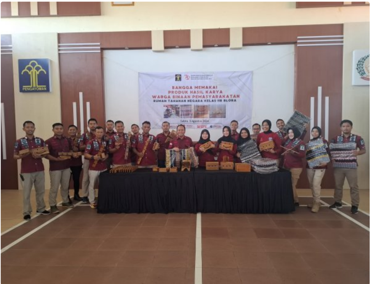
Rutan Blora Dukung Program Bangga Menggunakan Produk Warga Binaan

Blora - Rumah Tahanan Negara (Rutan) Kelas IIB Blora melaksanakan Kegiatan